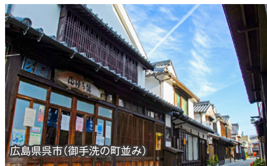
広島県呉市(御手洗の町並み)