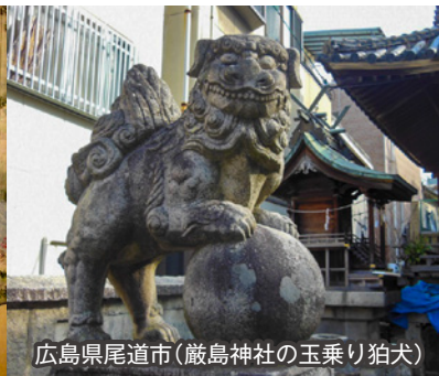
広島県尾道市(厳島神社の玉乗り狛犬)