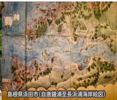
島根県浜田市(自唐鐘浦至長浜浦海岸絵図)