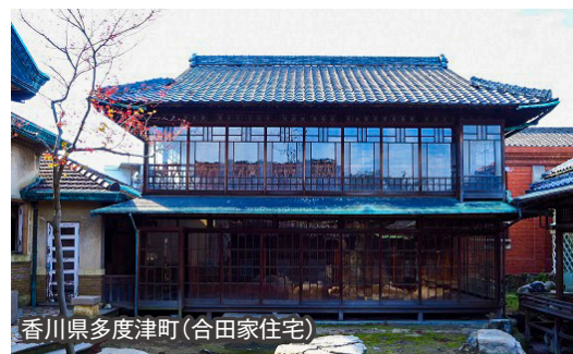
香川県多度津町(合田家住宅)