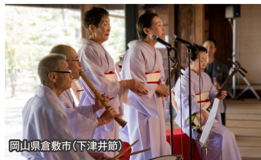
岡山県倉敷市(下津井節)