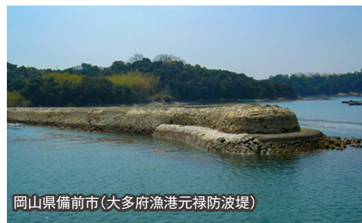
岡山県備前市(大多府漁港元禄防波堤)