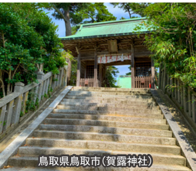
鳥取県鳥取市(賀露神社)